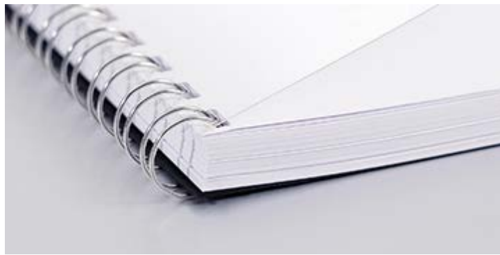
Abbildung 8. Metallring-Bindung und mattes, transparentes Deckblatt

Alle schriftlichen Arbeiten sind in gebundener Form in einfacher Ausführung im Sekretariat oder bei dem jeweiligen Betreuer abzugeben. Für das Binden der Arbeit dürfen für den Binde- rücken nur schwarze oder silbrige Metall- und keine Plastikringe verwendet werden (vgl. Abb. 8). Die Arbeit ist einseitig zu drucken.